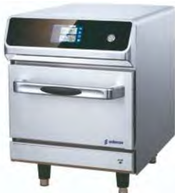
Cocción y Hornos - Horno de alta velocidad - Chef-N-Go!